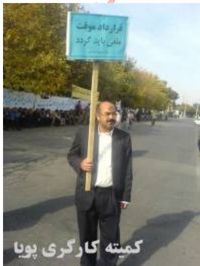
کمیته کارگری پویا

7- اتحادیه سراسری کارگران اخراجی و بیکار به نوبه خود تلاش خواهد کرد تا شرایط لازم در جامعه برای تصویب قانون کار توسط نماینده های منتخب مجامع عمومی کارگری و تشکلهای سازمانیافته بر خاسته از آن فراهم شود